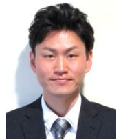
仁恵会本部事務課長 兼 人工透析ひ尿器科 じんけいクリニック 事務長

この度、仁恵会人工透析ひ尿器科じんけいクリニック事務長兼本部課長を拝命しました事です。31歳に臨床工学技士として入職させていただき9年、現在は事務職として働かせていただいております。自身の人生プランの中に事務長というのは、とても大きな目標として掲げていたので、今回事務長として働けることはとても感慨深く、まだまだ未熟な私をここまで成長させてくださった仁恵会スタッフの皆様、そしていろいろな場面でご自身の気持ちを教えてくださり指摘・指導そして感謝の言葉をくださった患者様の皆様には、心から大変感謝しております。私は、目標を掲げそのためには何が必要か、達成するためには・・・と、真っ直ぐしか見れなくなることが多々あります。目の前の事をする事で精一杯になりがちで、周りが見えていないところもあります。その中でいろいろなお言葉をいただくことは、私の考え足らずなところを、教えてくださる事そのものだと考えております。その中で私ができる事をこれからも精一杯やりきり、仁恵会が地域の皆様に必要な医療機関であることを示していくため全力で頑張ります。どうぞよろしくお願いいたします。