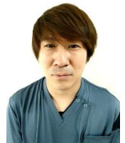
人工透析ひ尿器科 じんけいクリニック 臨床工学技士 副主任

微力ながら、今後も患者様に安全な透析医療を提供できるように、そして当院の発展のために力を尽くしていきたいと思っておりますので、ご指導ご鞭撻を賜りますよう、よろしくお願い申し上げます。