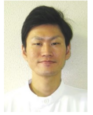
臨床工学技士 技士長

今回の発表が、患者様のケアに生かせるよう、これからも日々研鑽し努力し続け頑張りたいと思います。