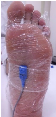
① 足の裏にセンサーを貼ります