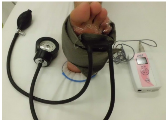
② 血圧計を巻き、測定を行います