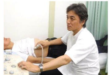
(泌尿器科外来 診察の様子)