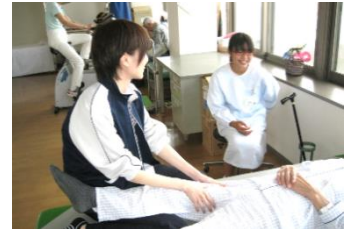
(各部署にて色々な体験をする生徒さん達)