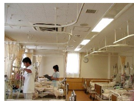
(石井病院透析室：10床)

石井病院と人工透析ひ尿器科じんけいクリニックの医師・看護師・臨床工学技士・看護助手が協働して、他の病院からの精査依頼やリハビリ療養、終末期対応など様々な目的の透析患者様を受け入れています。通院患者様に治療が必要となった場合は石井病院で入院透析を行い、退院後は通院透析に戻る体制が整っています。