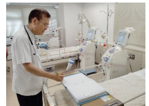
(クリニック透析室：39床)